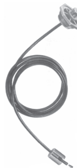
uniflex com 3,2 metros