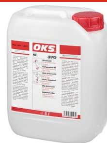
5L / 400ml (spray)