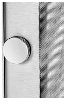
Placa frontal amovível 2 parafusos com cabeça serrilhada para fixação manual