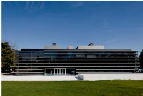
LABORATÓRIO CENTRAL EPAL