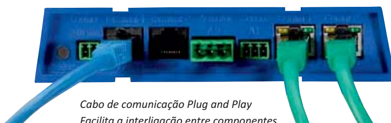
Cabo de comunicação Plug and Play Facilita a interligação entre componentes