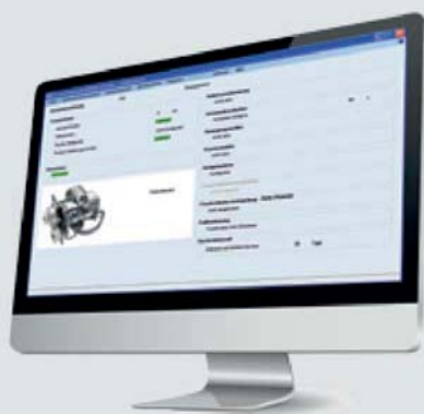
Colocação em serviço fácil e intuitiva com o software TROX Easyconnect

Uma vasta gama de opções faz do EASYLAB um sistema flexível tanto em termos técnicos como em custos.