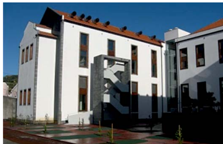
DEPARTAMENTO OCEANOGRAFIA E PESCAS (UNIVERSIDADE DOS AÇORES)