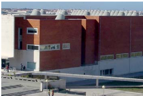
UNIVERSIDADE DE AVEIRO Laboratório de Química