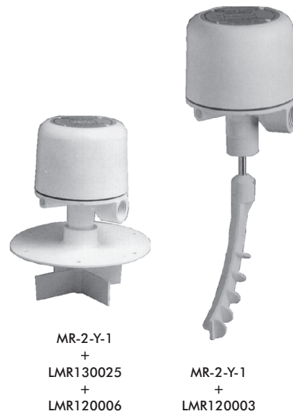
MR-2-Y-1 + LMR130025 + LMR120006