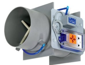
TRIPLA FUNÇÃO REGULAÇÃO, TRANSMISSÃO E BLOQUEIO

Fuga através da lâmina completamente fechada: classe 3 segundo norma DIN EN1751.