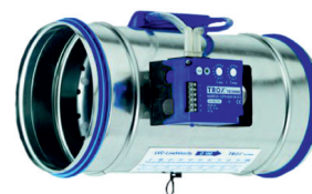
TRIPLA FUNÇÃO REGULAÇÃO, TRANSMISSÃO E BLOQUEIO

Montagem - em qualquer posição e em qualquer localização (mesmo após uma curva ou derivação), tanto na insuflação como no retorno/exaustão