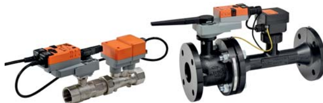
DN15 ... DN50