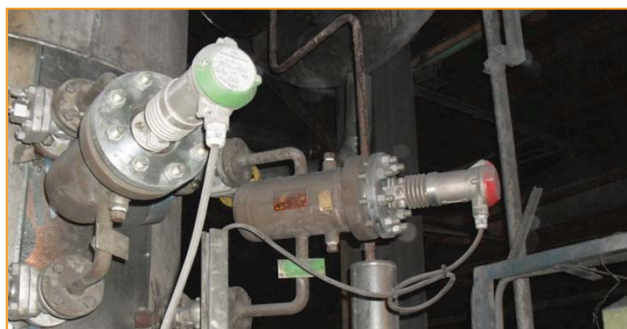
Trimod Besta Interruptor de nível tipo: HAA 22C01 041 Besta câmara de flutuador tipo: I021-1C0RC1